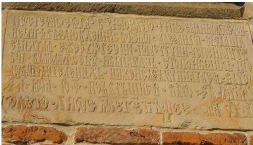
Copyright by Vladimir Cherny, GNU Free Documentation License, Low Resolution