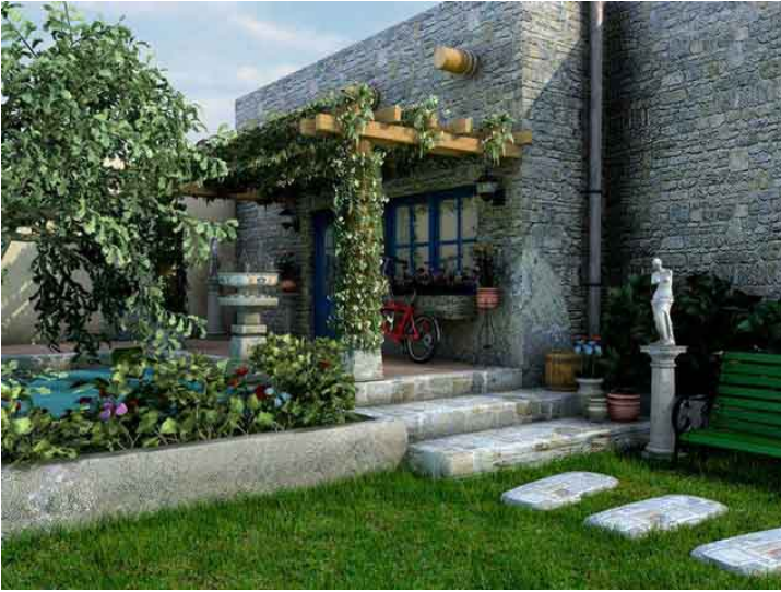
Copyright Gregor Kumbel and Alex Sander. GNU Free Documentation License. Low Resolution